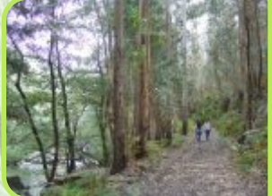
Serra de Pias